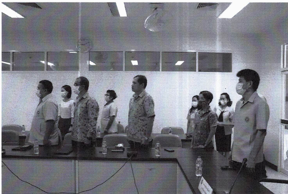
อบรมข้าราชการบรรจุใหม่ 19 - 20 กุมภาพันธ์ 2564 ณ สำนักงานสาธารณสุขจังหวัดภูเก็ต